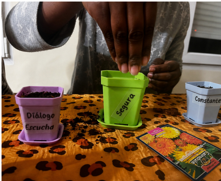
Celebrando el día internacional de la mujer.