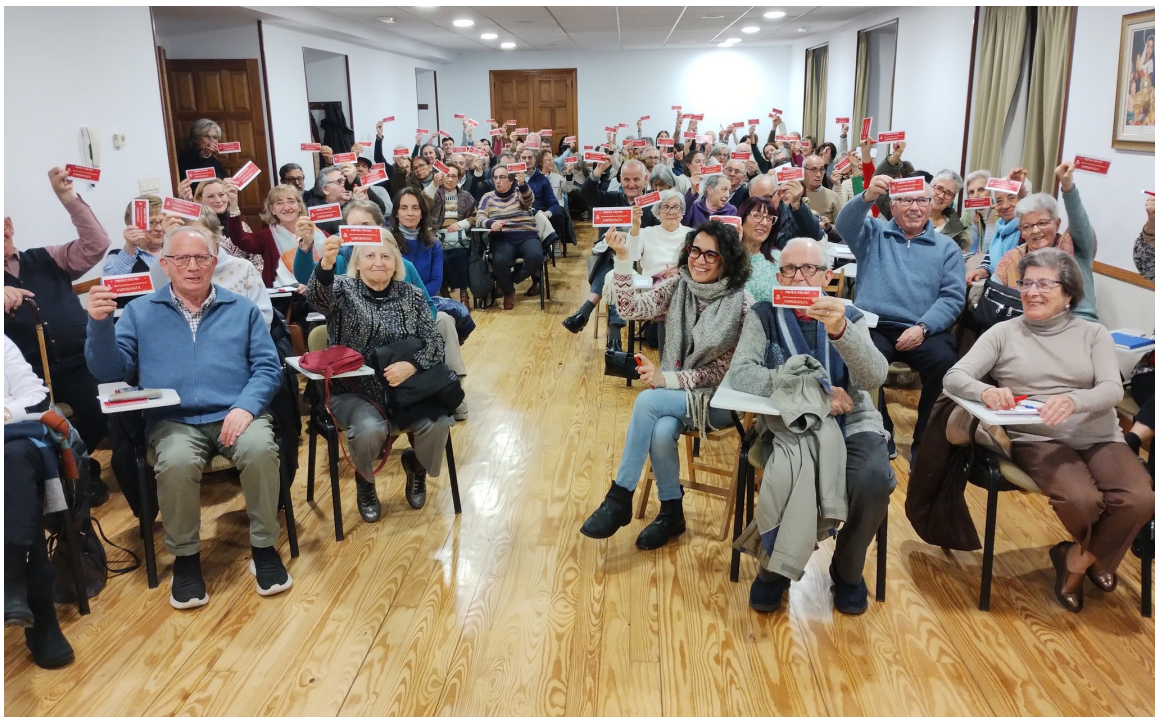
Encuentro de representantes de Cáritas parroquiales.

Compartimos quiénes somos y qué hacemos a través de nuestras redes sociales y de los medios de comunicación diocesanos y de la sociedad en general. Y llegamos también a centros educativos con talleres de sensibilización para despertar en los más jóvenes el compromiso con la construcción de una sociedad más justa, fraterna y solidaria .