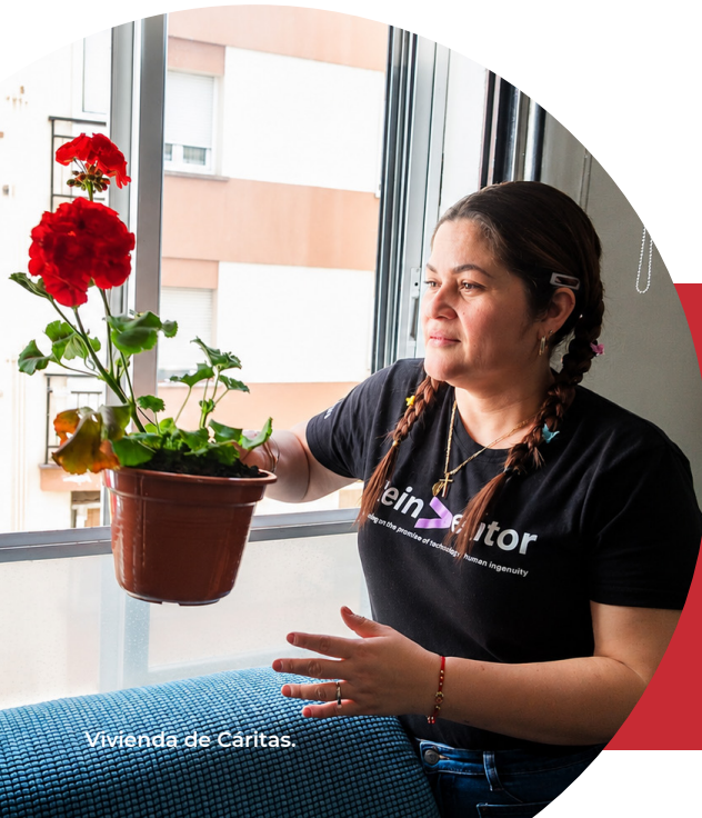
Vivienda de Cáritas.