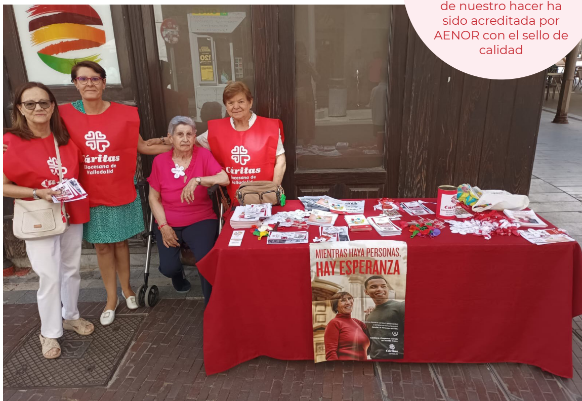
Mesa de sensibilización en Medina del Campo.

Un año más la calidad de nuestro hacer ha sido acreditada por AENOR con el sello de calidad