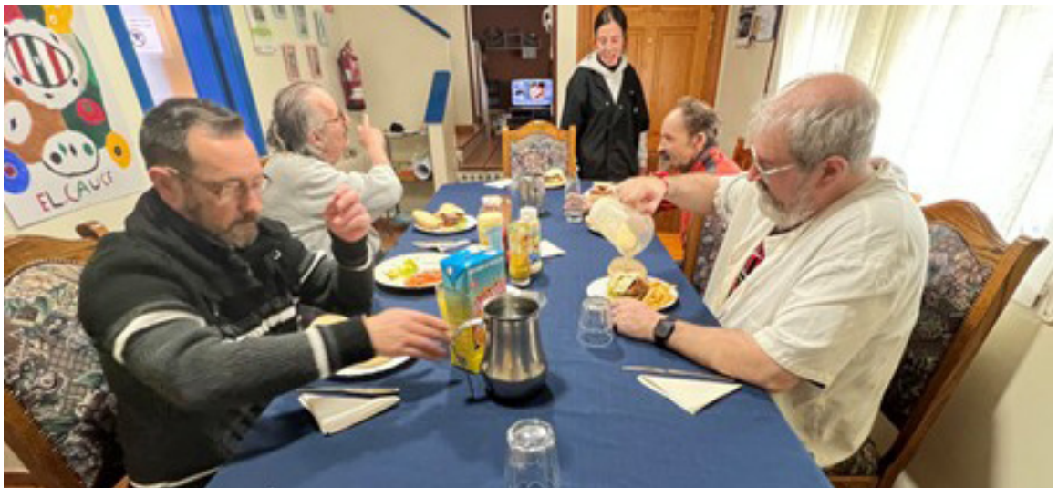
Casa de Acogida El Cauce.

Además, porque creemos que conocer es el primer paso para actuar, la edición de la Escuela de Formación Social de marzo de 2025 giró en torno al derecho a la vivienda. Una apuesta por la sensibilización y el compromiso, fiel a nuestra misión de denunciar las situaciones de injusticia y contribuir a transformarlas.