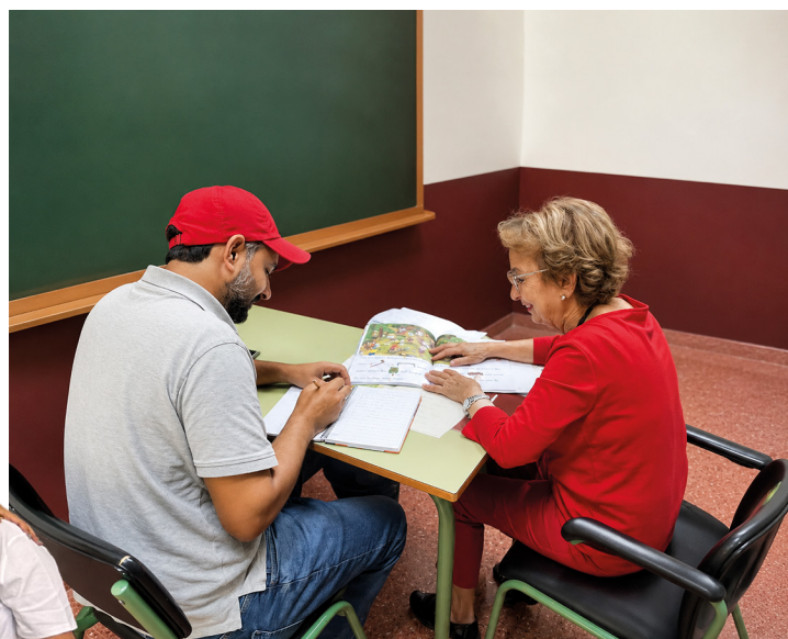
Actividad en una Cáritas Parroquial