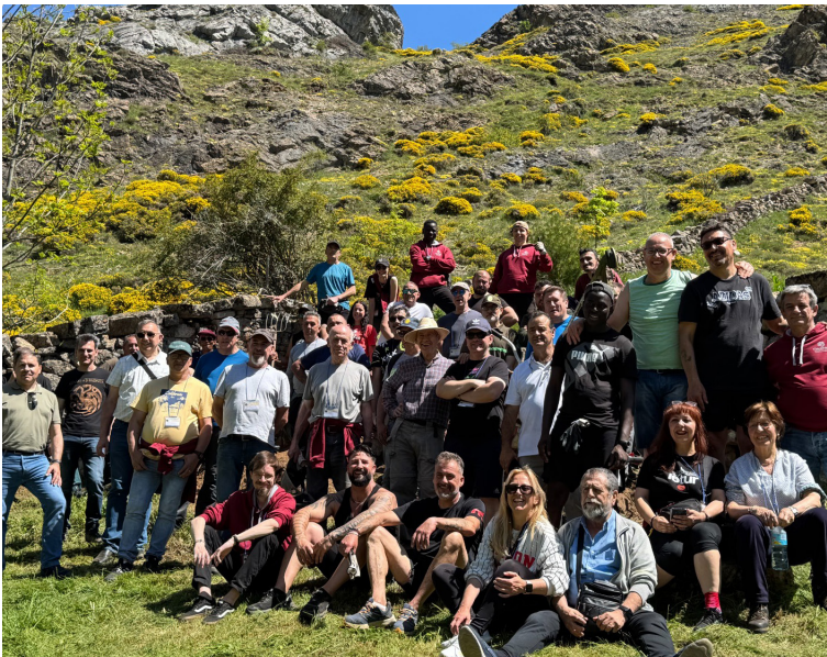
Excursión a Babia (León).