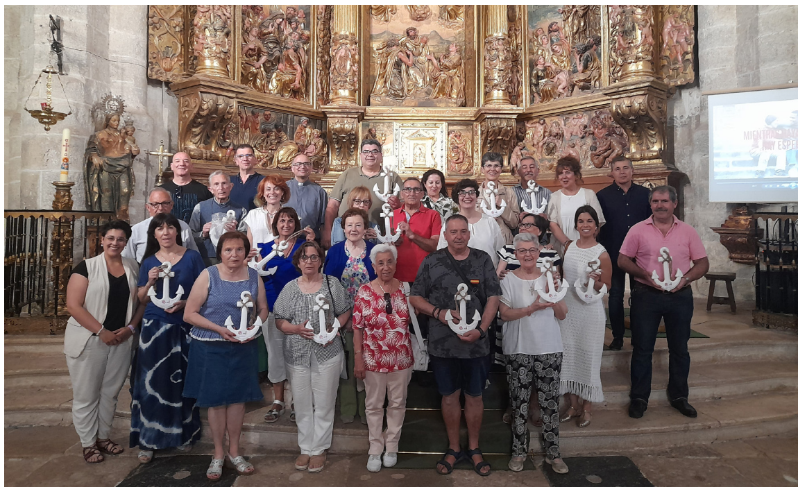
Encuentro del Arciprestazgo Oeste en Simancas.

Destacamos este año la creación de la coordinadora del barrio de las Delicias y la puesta en marcha de un equipo nuevo de Cáritas en la parroquia San Lorenzo. Además, se han renovado los equipos de San Ignacio y San Pascual Bailón. También destacamos la implicación de los equipos de la Cáritas parroquiales en la elaboración del II Plan Estratégico de Cáritas Diocesana y la formación sobre la realidad de la vivienda en nuestra provincia se han ofrecido en algunos arciprestazgos.