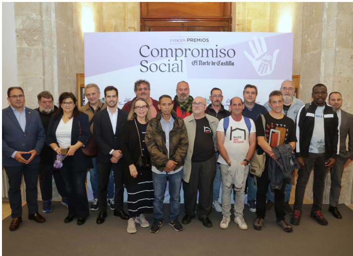
Premio al Compromiso Social del Norte de Castilla 2025.