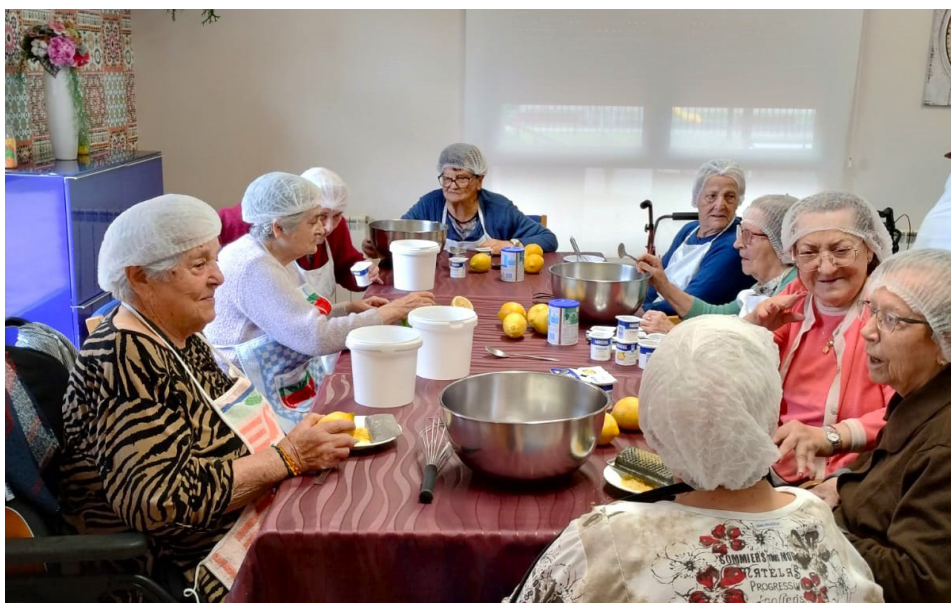
Residencia N o S o del Cármen.

Durante 2025, 148 Personas fueron acompañadas en esta etapa de su vida por 109 trabajadores , a quienes no nos cansamos de agradecer y reconocer su labor dedicada, cercana y comprometida. Su buen hacer es un referente dentro del mundo residencial de nuestra provincia.