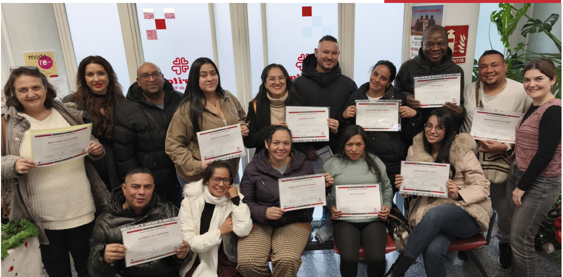
Curso certificado profesional de limpieza.