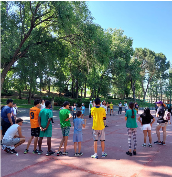
Actividad campamento urbano de verano.